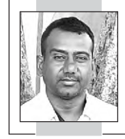
युवराज माने सेलू-परभणी

शाळा बंद होत्या तरी लेकरांचं शिकणं सुरू होतं हे मी ठामपणे सांगतो. कारण पहिल्यांदाच कुटुंबातले सर्व सदस्य एकत्र आले होते. ही मोठी संधी लेकरांना होती. सर्व सदस्यांनी एकत्र येऊन राहण्याचे प्रसंग यापूर्वी आले पण एक दोन दिवसासाठीचे आणि तेही सण, उत्सवात. पण कोरोनात अनेक महिने सोबत रहायला मिळाले. संकटात सोबत राहण्याची एक नवी शिख मिळाली. यात लेकरांना कुटुंबातील सर्व नातेवाईक जवळून अनुभवता आले. आजी-आजोबा यांचं कुटुंबातील स्थान, त्यांचे