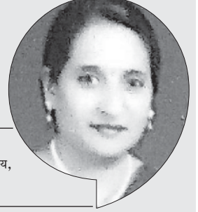
मनोरमा ओगले श्री संत गाडगे महाराज हिंदी विद्यालय, भुसावळ जि.जळगांव

जिं जिथे नारीचा सन्मान होतो, तिथे तिथे प्रत्येक ठिकाणी प्रगती निश्चित आहे. प्रत्येक कार्याची वृद्धी झालेली आढळून येते. आज संसारात म्हणजे विश्वात नारी जागर, नारीचे महत्व, नारीशक्ती यावर जास्तीत जास्त विचार केला जात आहे. कुटूंबात जर नारी शिक्षित असेल तर संपुर्ण कुटुंब सुशिक्षित होते. नारीचे अनेक विविध रूपे आपणास पहायला मिळतात. जसे की एक कन्या एक किशोरी, एक युवती, एक प्रौढ आणि एक वृद्ध महिला. या विविध रूपातून ती कधी पुत्री कधी बहिण, कधी आई, कधी पत्नी, मैत्रीण अशा विविध नात्यांची गुंफण सतत साकारत असते. नारी म्हणजे त्याग, समर्पण याच उत्कृष्ट उदाहरण आहे. कारण ती एक पुत्री, आई बनून तर एक पुत्नी आणि बहिण बनून घरातील फुलदाणी प्रमाणे घर प्रसन्न ठेवते. पत्नी आणि आई बनून घराला घरपण देऊन ममतेचे, वात्सल्याचे पांघरूण घालून घर प्रफुलीत करते. सगळ्यांना आपलेसे करते, मायेची ऊब देते. प्रेम वात्सल्य, आपुलकी, स्नेह, करूणा, या सर्वगुणांना सदगुणांना लेवून ती स्वतःचे समर्पण करते. ती सर्वांची जीवनदायिनी आहे. मी तर असं म्हणून की राष्ट्र समाज आणि विश्वाची जननी आहे.