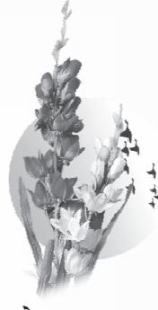
- शुभेच्छुक -