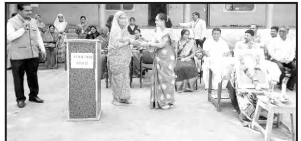
कष्टकरी महिलांचा सत्कार...आर.सी.पटेल प्रा.आश्रम शाळा वाघाडी, शिरपूर

गुरुदत्त कॉलनी, निमझरी नाका, शिरपूर जि.धुळे